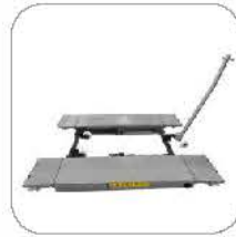
Mobile design 可移动小剪设计