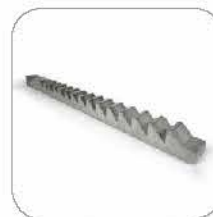
Galvanized safety rack against rust 镀锌安全齿条防止生锈