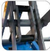
Stable launch & land design 加强助力器设计