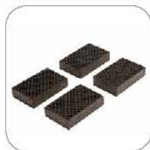
35mm lifting pads (4 pcs) 35mm 举升胶垫 (4 个)