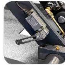
CE-Stop (foot protection) 下限位开关 (防压脚设 计)