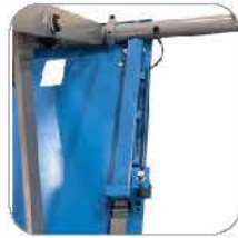
Automatic lock & release 全自动解锁 & 上锁