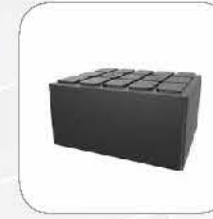
Lifting pads 60mm/80mm/100mm 举升胶垫 60mm/80mm/100mm