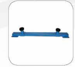
SUV adapter kit SUV 加高支架