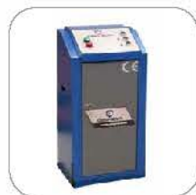
Standard control unit 标配电控箱