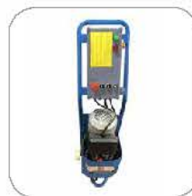
Optional control box 选配款电控箱