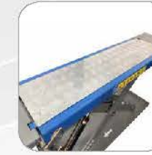
Aluminum top- platform 高档铝板上盖