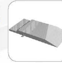
Additional drive-on ramps 加长上车跑板