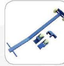
Mobile kit 移动组件