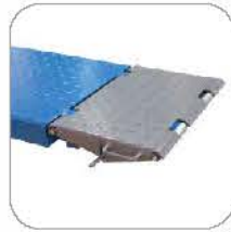
Extendible ramps 加长延伸板